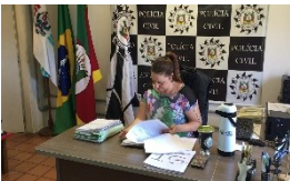
3. Análise do fato pela Autoridade Policial à luz da Portaria 168/14 da Chefia de Polícia.