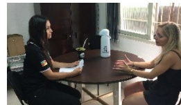
6. Audiência com o (a) demandado(a).