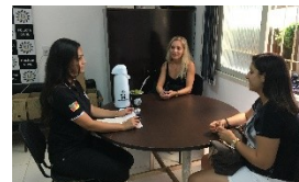
7. Audiência conjunta (querendo as partes).