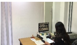
4. Pesquisado perfil dos envolvidos. Não havendo impeditivo é feito contato com as partes.