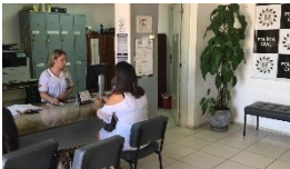
2. A pessoa busca auxílio do Estado na resolução do fato. Conflito registrado vira ocorrência policial.