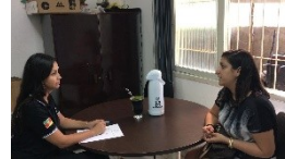
5. Audiência individual com o(a) demandante.